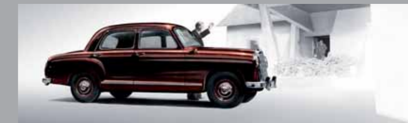
Modelo "Mercedes Ponton" - 1953 a 1959.

Personalidade, conforto e desempenho, mais uma vez a Classe E mostra-se imponente e reafirma sua competência de melhor sedan do mundo.