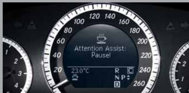
Aviso no painel de controle do sistema Attention Assist.