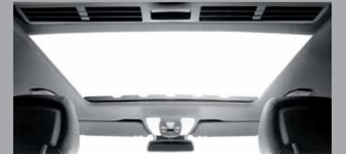
Teto solar de vidro com ajuste elétrico.

Mais funcionalidade e estilo aliados à tradicional excelência: a Classe E oferece uma experiência de conforto superior.