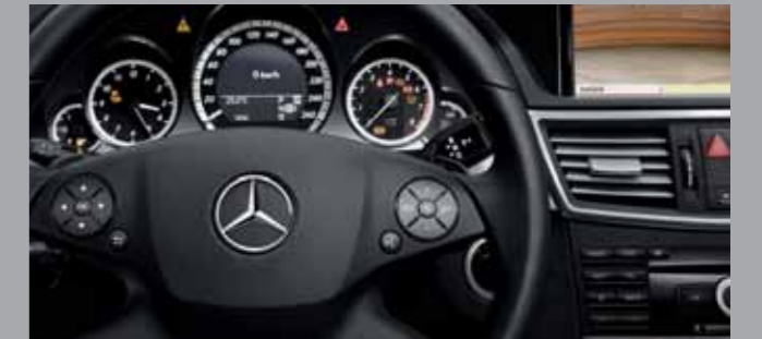
Volante multifuncional e alavanca de seleção de marchas DIRECT SELECT.