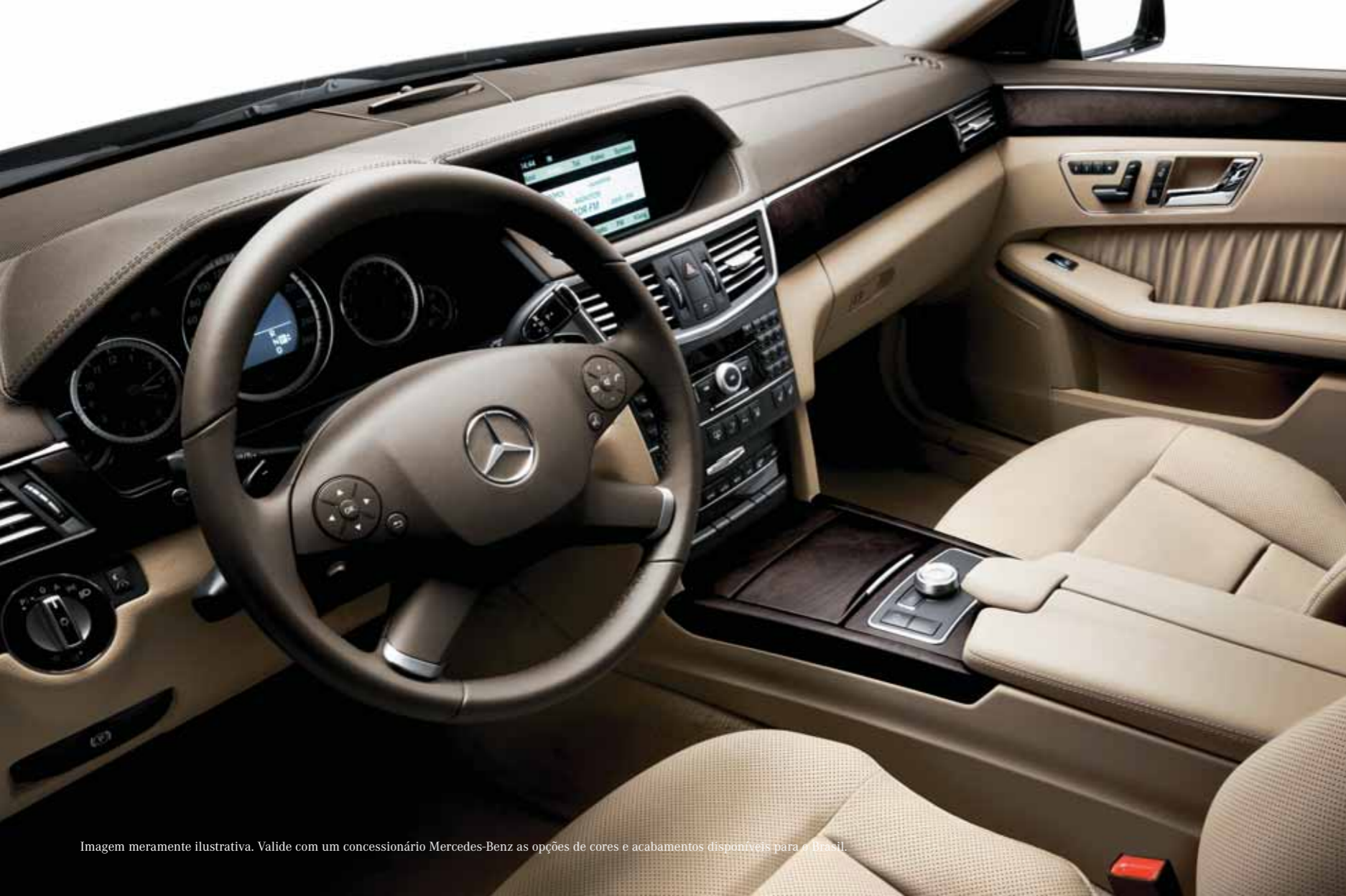
Imagem meramente ilustrativa. Valide com um concessionário Mercedes-Benz as opções de cores e acabamentos disponíveis para o Brasil.